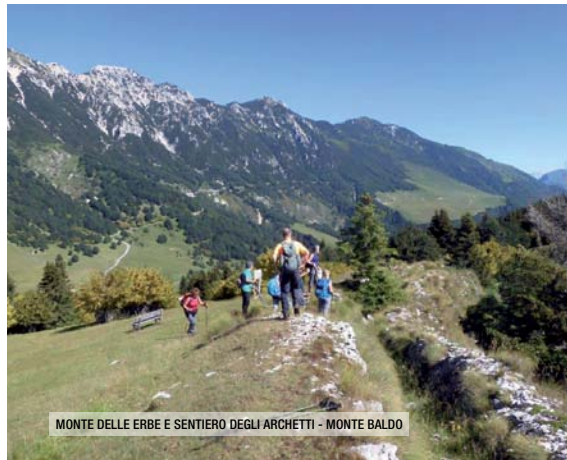
MONTE DELLE ERBE E SENTIERO DEGLI ARCHETTI - MONTE BALDO