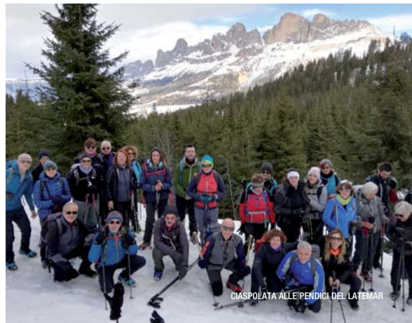
CIASPOLATA ALLE PENDICI DEL LATEMAR