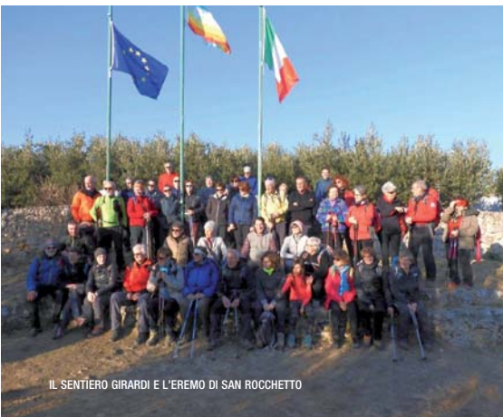
IL SENTIERO GIRARDI E L'EREMO DI SAN ROCCHETTO

Itinerario: parcheggio Ceniga (m 200), ponte romano, Maso Lizzone, sentiero degli Scaloni 428, percorso attrezzato coste Anglone, Doss Tondo (m 500), sentiero 428bis, parco Crozolan, sentiero 425 dell'Angiom, sentiero 632, ponte romano di Ceniga. Difficoltà: EEA; Dislivello: m 800 circa; Tempo: ore 5/6; Organizzazione: R. Persi e A. Colombini