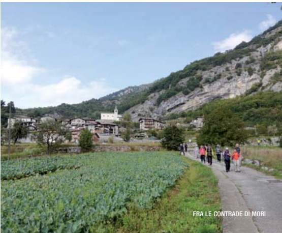
FRA LE CONTRADE DI MORI

Organizzazione: Commissione Escursionismo