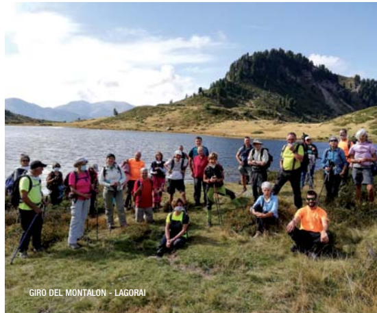
GIRO DEL MONTALON - LAGORAI