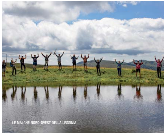
LE MALGHE NORD-OVEST DELLA LESSINIA