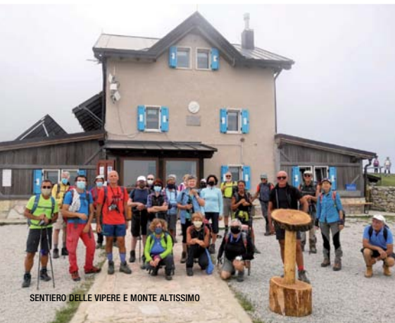
SENTIERO DELLE VIPERE E MONTE ALTISSIMO

Itinerario: Malga Movlina (m 1786), Passo Bregno de l'Ors (m 1836), Rif. XII Apostoli (m 2489), Chiesetta Madonna Ausiliatrice (m 2512), Passo XII Apostoli (m 2620), Malga Movlina. Difficoltà: EE; Dislivello: m 950; Tempo: ore 6/7; Organizzazione: R. Abate e A. Ceradini