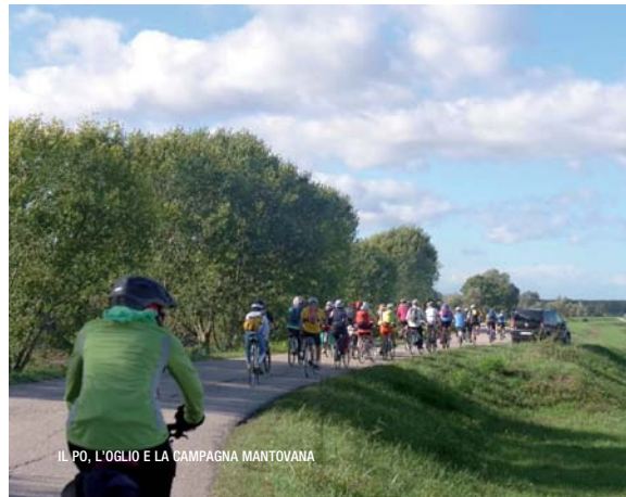
IL PO, L'OGLIO E LA CAMPAGNA MANTOVANA