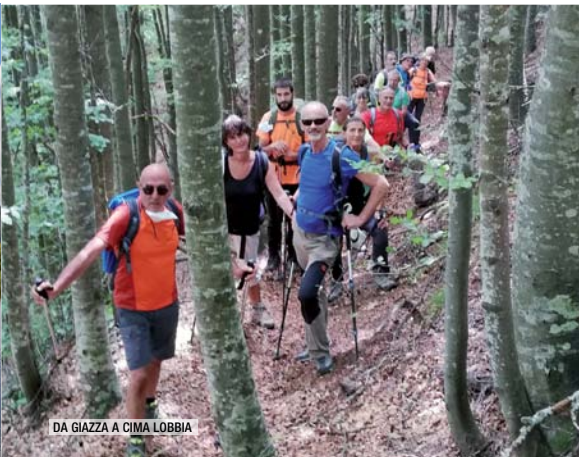
DA GIAZZA A CIMA LOBBIA

Itinerario: Malga Pracupola (Kupperlwiser Alm) (m 1980), Passo di Laces (m 2507), Wintersattel (m 2790), Blaue Schneid (m 3036), Cima (m 3257), rientro per il medesimo itinerario. Difficoltà: EE; Dislivello: m 1280; Tempo: ore 7/8; Organizzazione: G. Bendazzoli e S. Mazzi