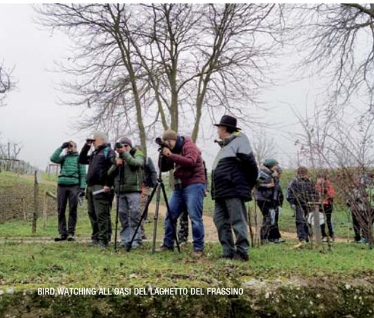
BIRD WATCHING ALL'OASI DEL LAGHETTO DEL FRASSINO

Itinerario: Parcheggio Coler (m 1380), Malga Ortisel (m 1895), Baito Sasso Vecchio (m 2279), Cascata alta Saént (m 1750), Dos della Croce (m 1799), Cascate basse, Malga Stablazol (m 1540), Parcheggio Coler (m 1380). Difficoltà: E; Dislivello: m 850; Tempo: ore 6 circa; Organizzazione: R. Persi e C. Sala