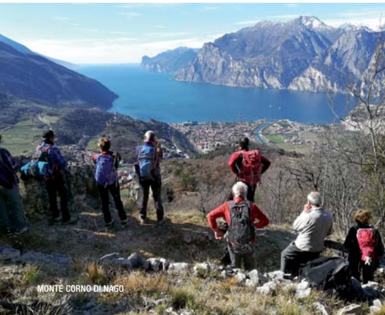
MONTE CORNO DI NAGO

Itinerario: Rif. Cimon della Bagozza (m 1575), Malga Campelli (m 1640), Madonnina Campelli (m 1705), Lago dei Campelli (m 1680), Passo delle Ortiche (m 2292), Cima (m 2408), Passo del Valzellazzo con nuovo Bivacco (m 2016), Rif. Cimon della Bagozza. Difficoltà: EE; Dislivello: m 1000 circa; Tempo: ore 6; Organizzazione: G. Bendazzoli e R. Bertoni