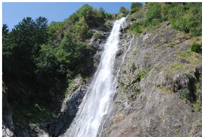
Cascata di Parcines