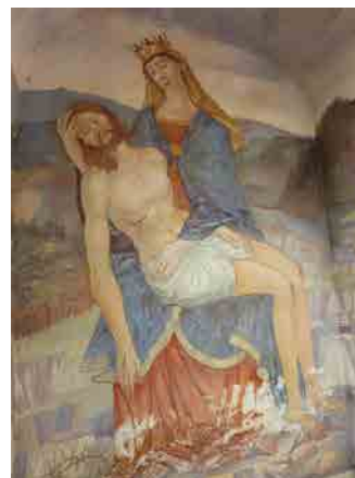
Capitello del 1786 tra Scala e Croce