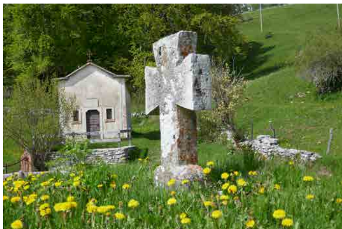
Chiesetta del 1837 a Scalon