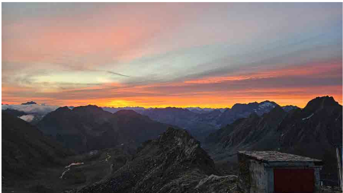
L'alba dal Rifugio 3A